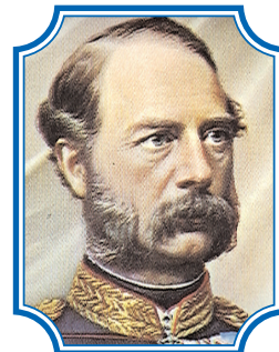
Født i kong Christian IX's regeringstid.